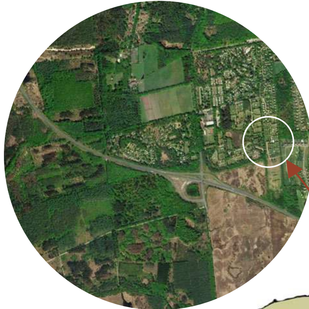
De bosrijke omgeving van Appelscha

“MEDE DOOR DE LIGGING TUSSEN DE BOSSEN EN AAN EEN GOLFBAAN IS DIT EEN UNIEK RECREATIEPARK”